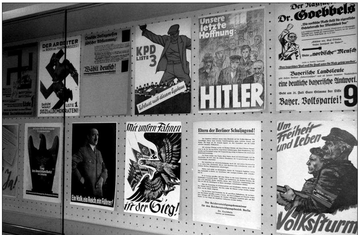
Plakate im Schaukasten