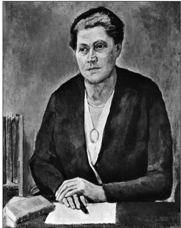
Suzanne Schwob malte dieses Bild nach der Schweizerischen Ausstellung für Frauenarbeit (SAFFA), als die Initiantin und Leiterin dieses grossen Werkes auf der Höhe ihres Schaffens stand.

Im Gegensatz zu den Knaben, die durch Zünfte und Verbände bei der Berufswahl auf eine lange Tradition zurückgreifen konnten, musste bei den Mädchen alles neu aufgebaut werden. Vom ersten Tag an wurde eine Statistik erstellt, um die Behörden von der Notwendigkeit dieser Institution zu überzeugen.