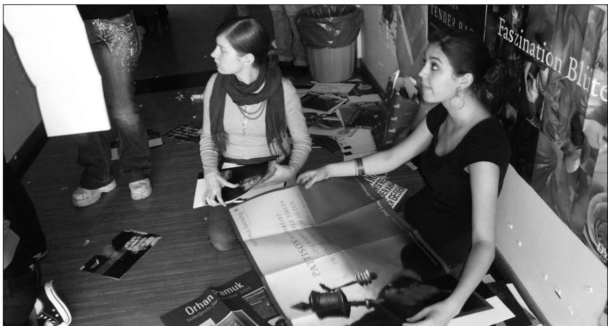
... in (Plakat-) Aktion!