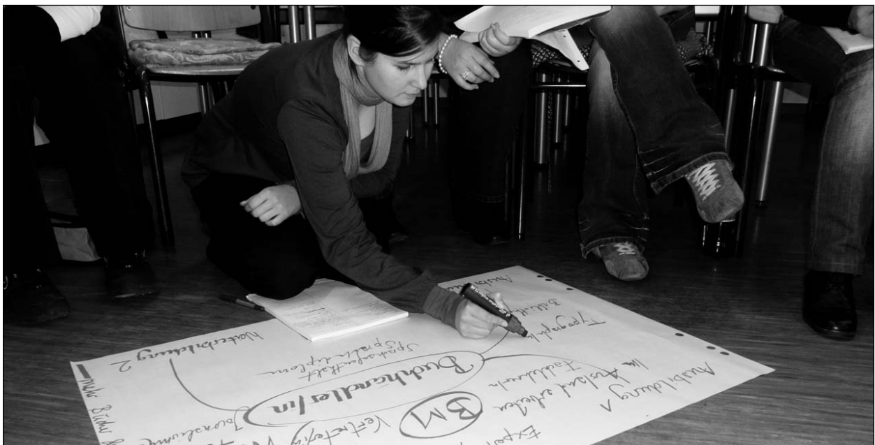
Die eigene Perspektive skizzieren.